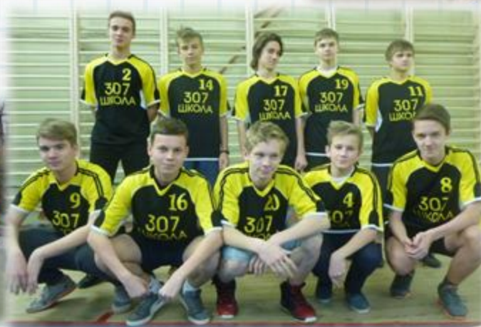
Баскетбольная команда. Первенство города.