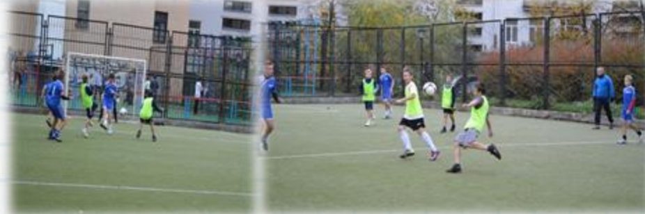
Футбол. Первенство района.